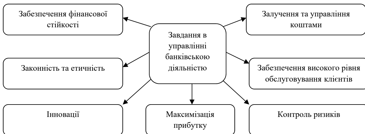
Рис. 1. Основні завдання в процесі управління банківською діяльністю (авторська розробка)

Основні принципи в процесі управління банком можуть варіюватись залежно від конкретної стратегії та мети банку, а також від його масштабів та специфіки діяльності. На рис. 1 відображені основні завдання в процесі управління банківською діяльністю.