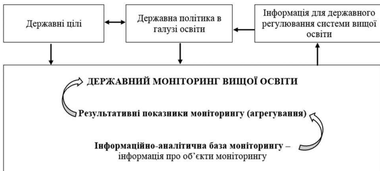
Рис. 1. Взаємозв'язок державних цілей, державної політики в галузі освіти та моніторингу вищої освіти

Результатом моніторингу буде інформація, на підставі якої будуть прийматися управлінські рішення щодо регулювання галузі освіти і розробляватись пропозиції щодо зміни цілей політики держави в цій галузі (рис. 1).